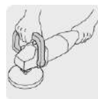
Mango abatible tipo "D"